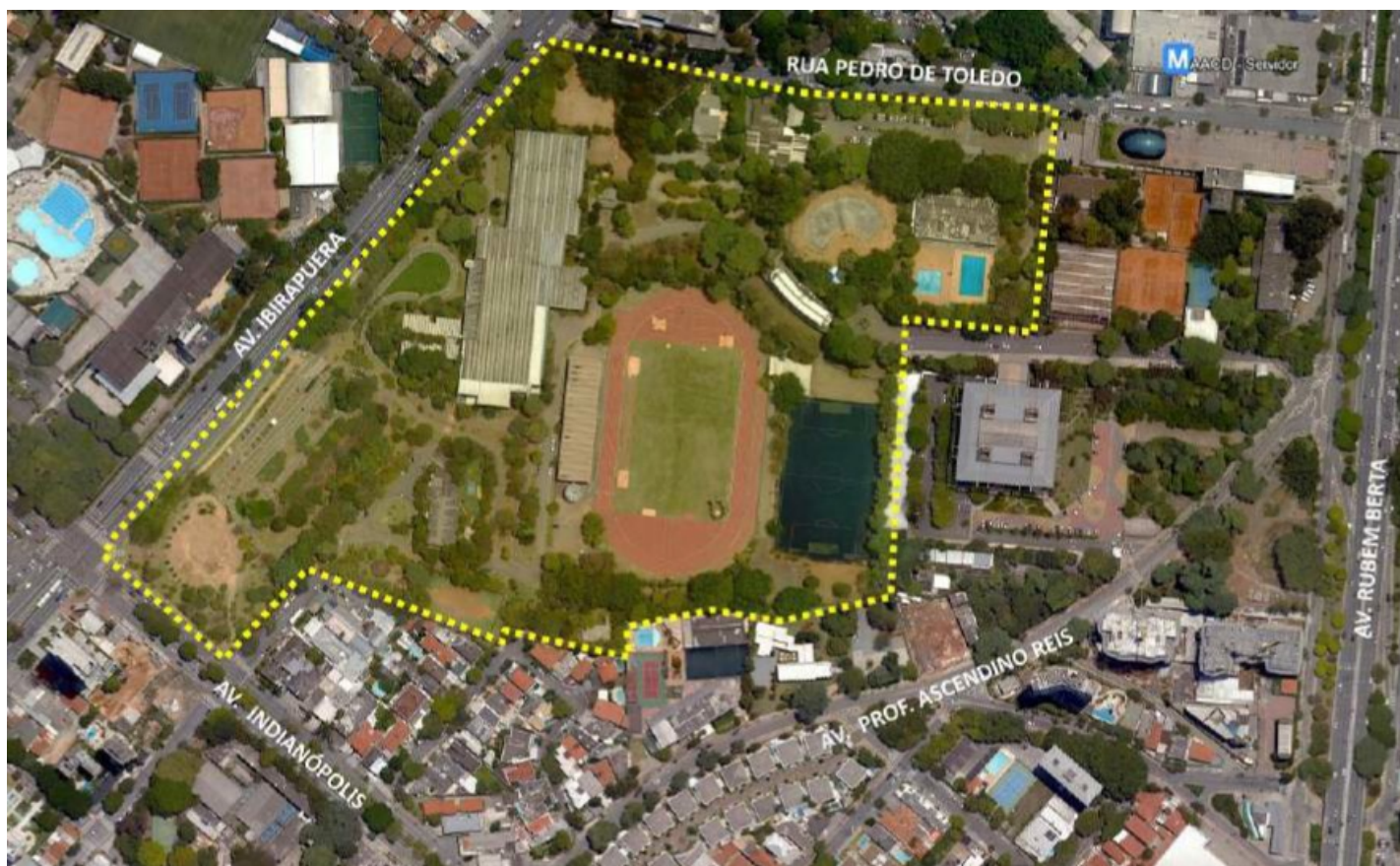
Figura 1 – Vista aérea da área onde será implantada a Arena Esportiva e o Edifício Garagem.

Sobre a escolha do local para a implantação da Arena Rei Pelé: De acordo com os documentos disponibilizados para a consulta pública, “Como premissas do projeto, serão mantidos os equipamentos existentes como COTP, a pista de Atletismo, o Parque das Bicicletas, a pista de caminhada, entre outros, além de serem integrados fisicamente à nova edificação proposta”.