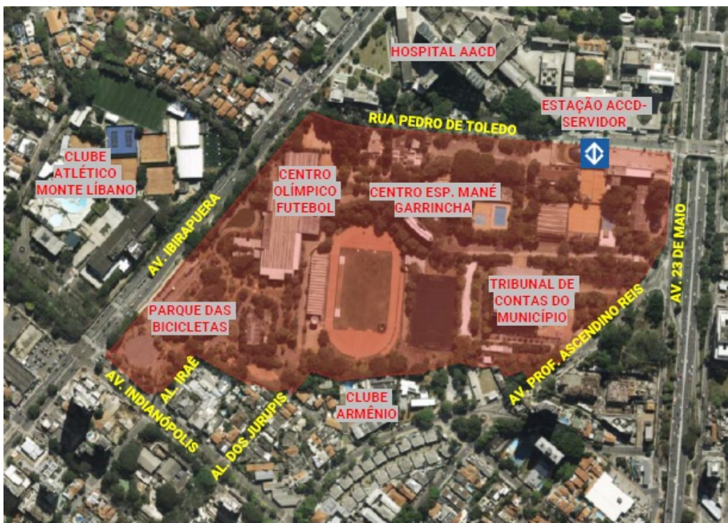
Figura 2 – Vista aérea da área dos equipamentos existentes na área onde será implantada a Arena Esportiva e o Edifício Garagem.